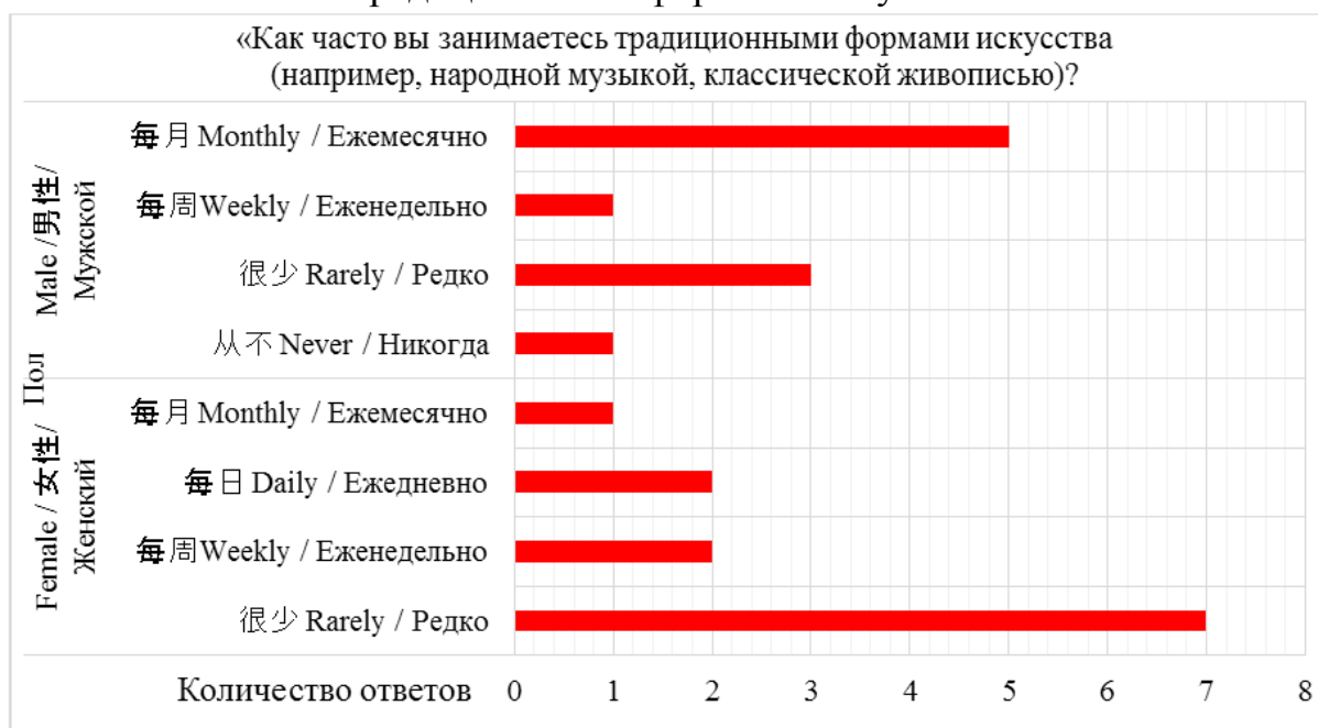
Рисунок 1. Диаграмма распределения ответов среди опрошенных о частоте занятий традиционными формами искусства

Мнения по поводу самой большой угрозы традиционной культуре разделились. Часть опрошенных считает, что никакой угрозы нет, а другая часть считает, что угрозами являются: недостаточная устойчивость к новым направлениям культуры, в том, что молодежь не понимает смысла традиционной культуры, на нее меньше стали обращать внимания и не пропагандируют ее.