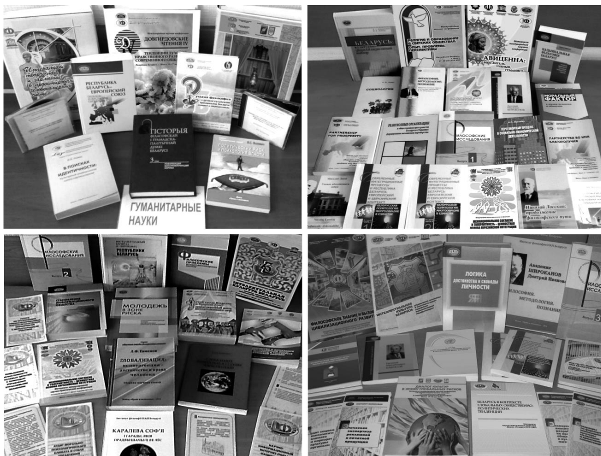
Издания Института философии НАН Беларуси

наименований научной, учебно-методической, справочной и научно-популярной литературы. В числе крупных изданий, увидевших свет в последние годы – 1-й, 2-й, 3-й, 4-й тома шеститомной «Истории философской и общественно-политической мысли Беларуси», 1-й том «Истории эстетической мысли Беларуси», а также монографии «Безопасность Беларуси в гуманитарной сфере: социокультурные и духовно-нравственные проблемы» (Минск 2010), «Республика Беларусь – Европейский союз: проблемы и перспективы партнерства» (Минск 2013), «Беларусь: культурно-цивилизационный выбор» (Минск 2014), «Интеллектуальный капитал и потенциал Республики Беларусь» (Минск 2015), «Становление информационного общества: коммуникационно-эпистемологические и культурно-цивилизационные основания» (Минск 2015), «Логика достоинства и свободы личности» (Минск 2016) и многие другие. Целый ряд изданий увидели свет за пределами Республики Беларусь. Книги института и его сотрудников издаются на белорусском, русском, английском, польском, словацком и других языках.